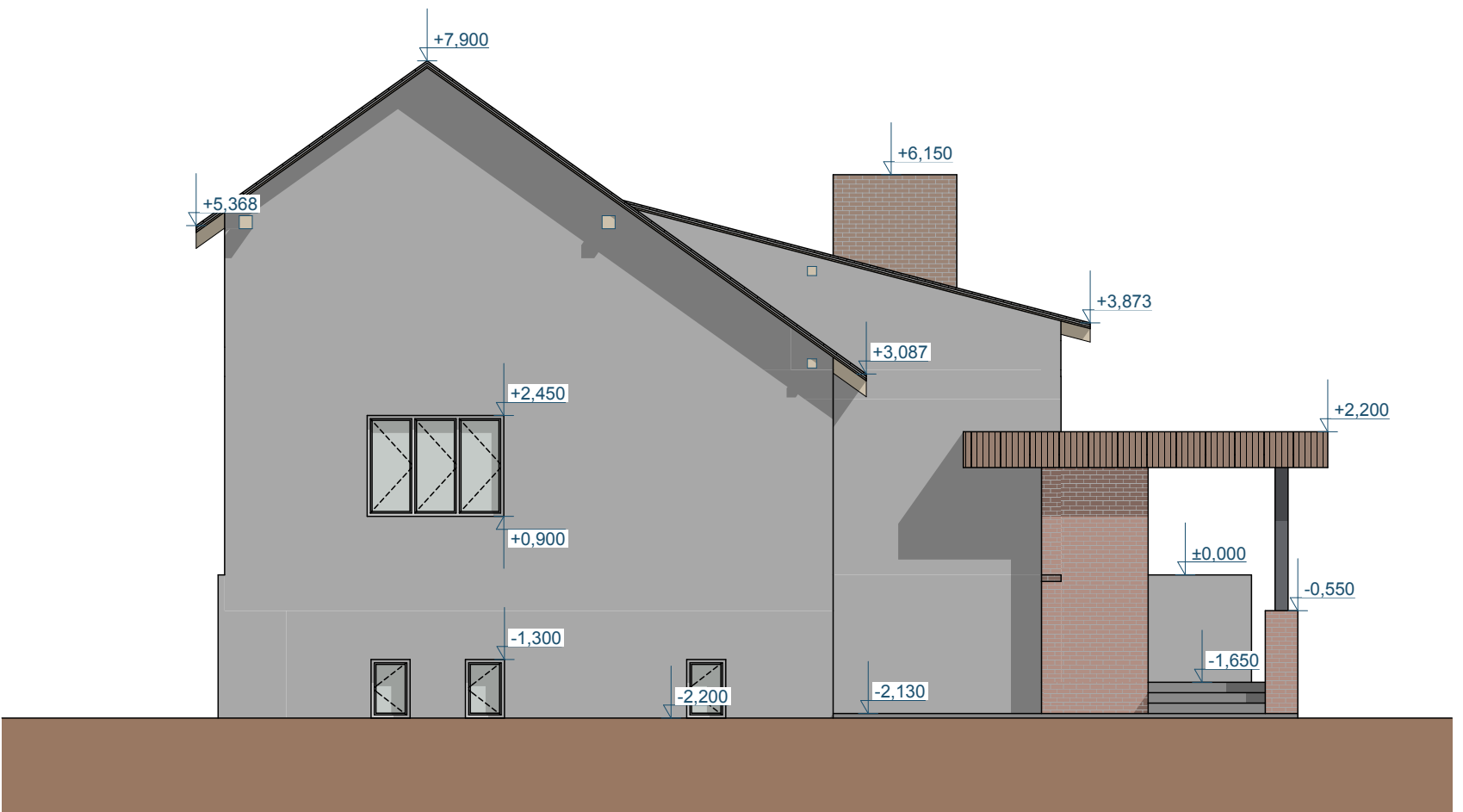
Pohled západní Pohled 1:100